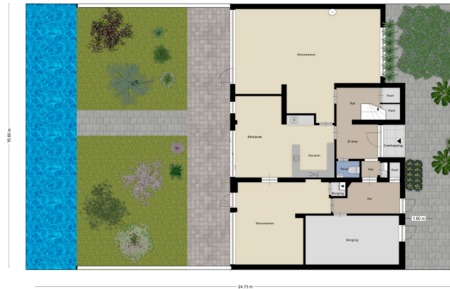
Aan de plattegronden kunnen geen rechten worden ontleend © Zibber www.zibber.nl