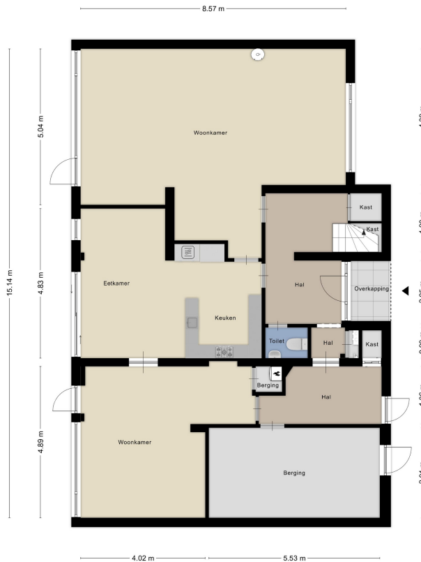
Aan de plattegronden kunnen geen rechten worden ontleend © Zibber www.zibber.nl