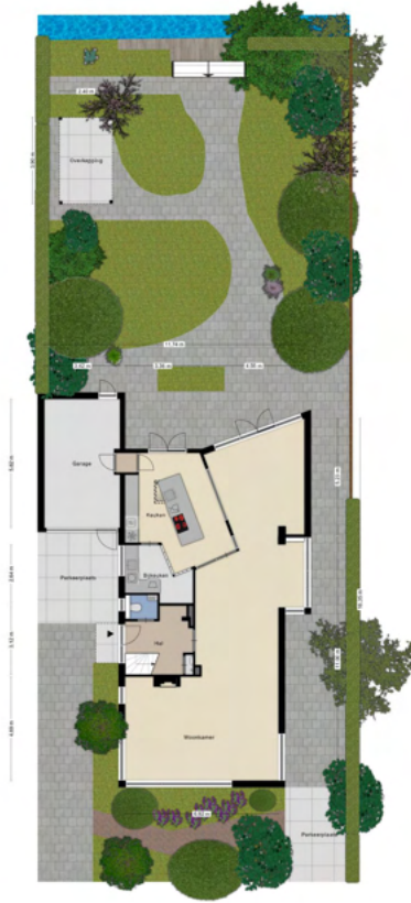
Aan de plattegronden kunnen geen rechten worden ontleend