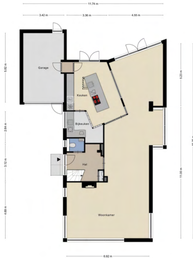
Aan de plattegronden kunnen geen rechten worden ontleend © Zibber www.zibber.nl